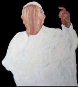
pope óleo sobre mdf 100 x 80 cm 2015/2017