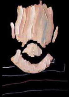
autorretrato (detalle) óleo sobre mdf 100 x 70 cm 2017