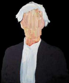
andy óleo sobre mdf 70 x 50 cm 2017