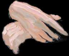
elle (detalle) óleo sobre mdf 70 x 50 cm 2017